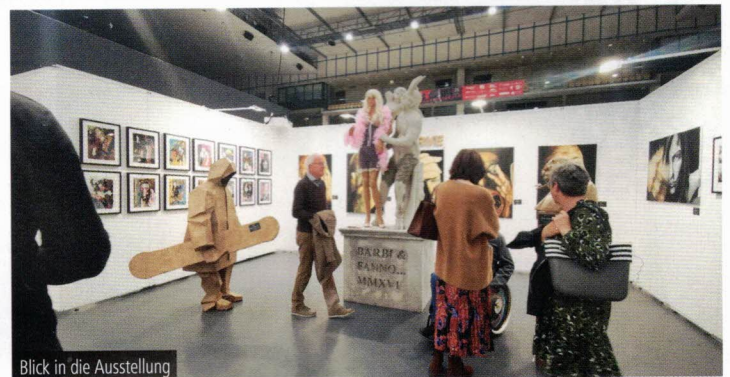
Blick in die Ausstellung