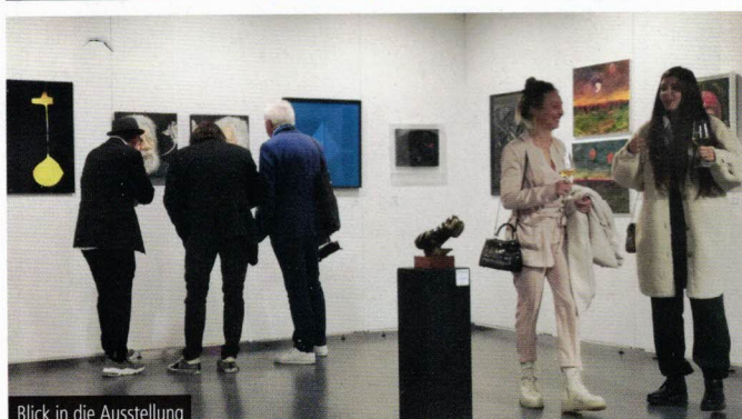
Blick in die Ausstellung