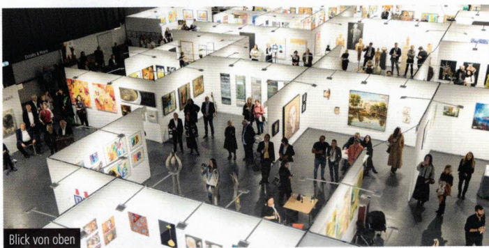
Blick von oben

PEFA FINE ART Ltd Niederlassung Österreich: Gutenbergstraße 3/22, 6020 Innsbruck, Austria Tel. +43(0)512 567101 office@artfair-innsbruck.com www.artfair-innsbruck.com