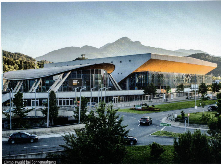
Olympiahalle bei Sonnenaufgang