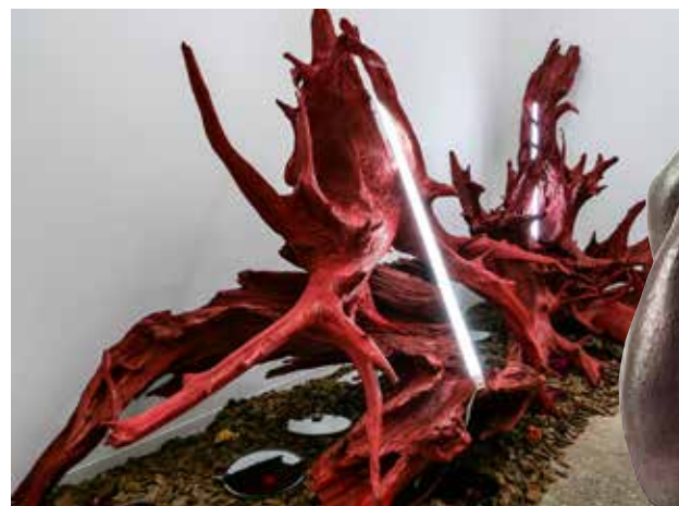
Nakamura Tomotsugu, Dancing Tree, 2020, Tom29 gallery