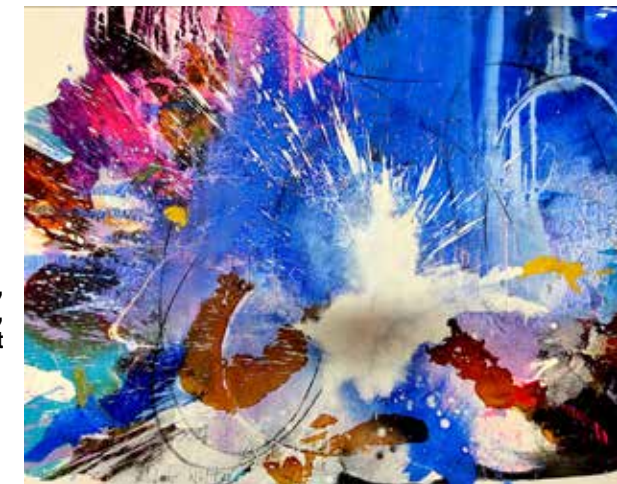
Woelfl Dietmar, ohne Titel 1, 2021, ARTEG moderne Kunst