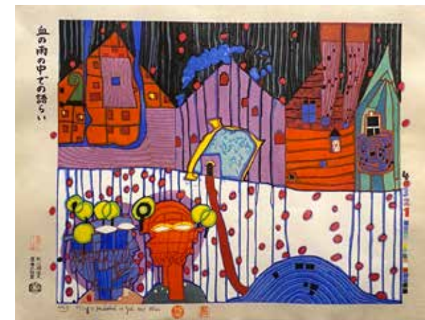
Friedensreich Hundertwasser, Gespräch im Blutregen, 1997, Galerie WOS

IA international artfairs GmbH Gutenbergstraße 3, 6020 Innsbruck, Tel.: 0512 / 567101 office@art-innsbruck.com, www.art-innsbruck.com