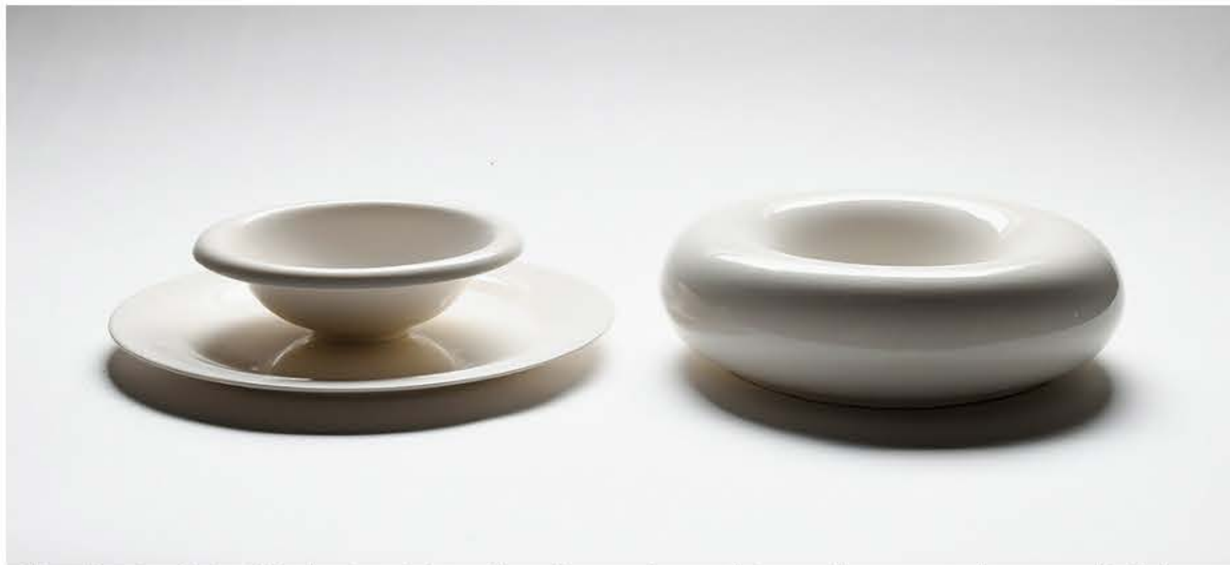
Bálint Viola „Fine dining étkezéslet, Fine Dining Tafelgeschirr“ aus der Installation „Café“ 2023, Porzellan unterschiedlicher Größe, Kunstfakultät der Universität Pécs Ungarn