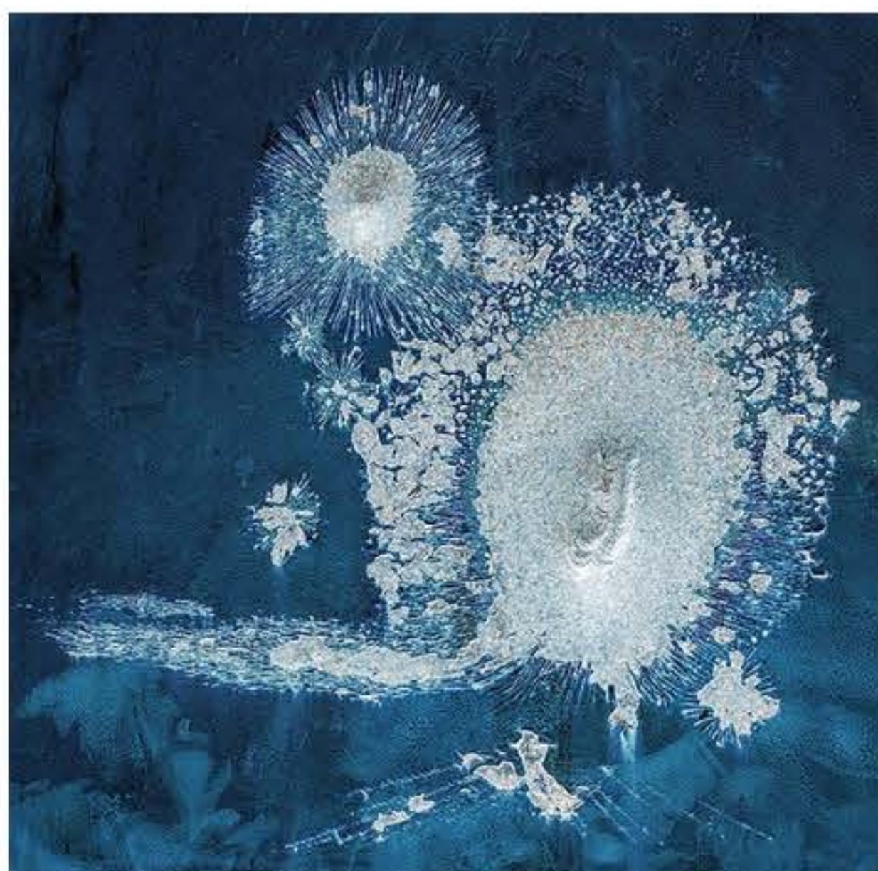
Thomas Driendl „Incredible Creature“ 2023, Hahnmühle FineArt Baryta auf AluDiobond im Schattenfugenrahmen, 40 x 40 cm, Limited Edition 5+1 AP mit Zertifikat und Registrierung auf myartregistry.com, GALARTERY fine art, Innsbruck-AT