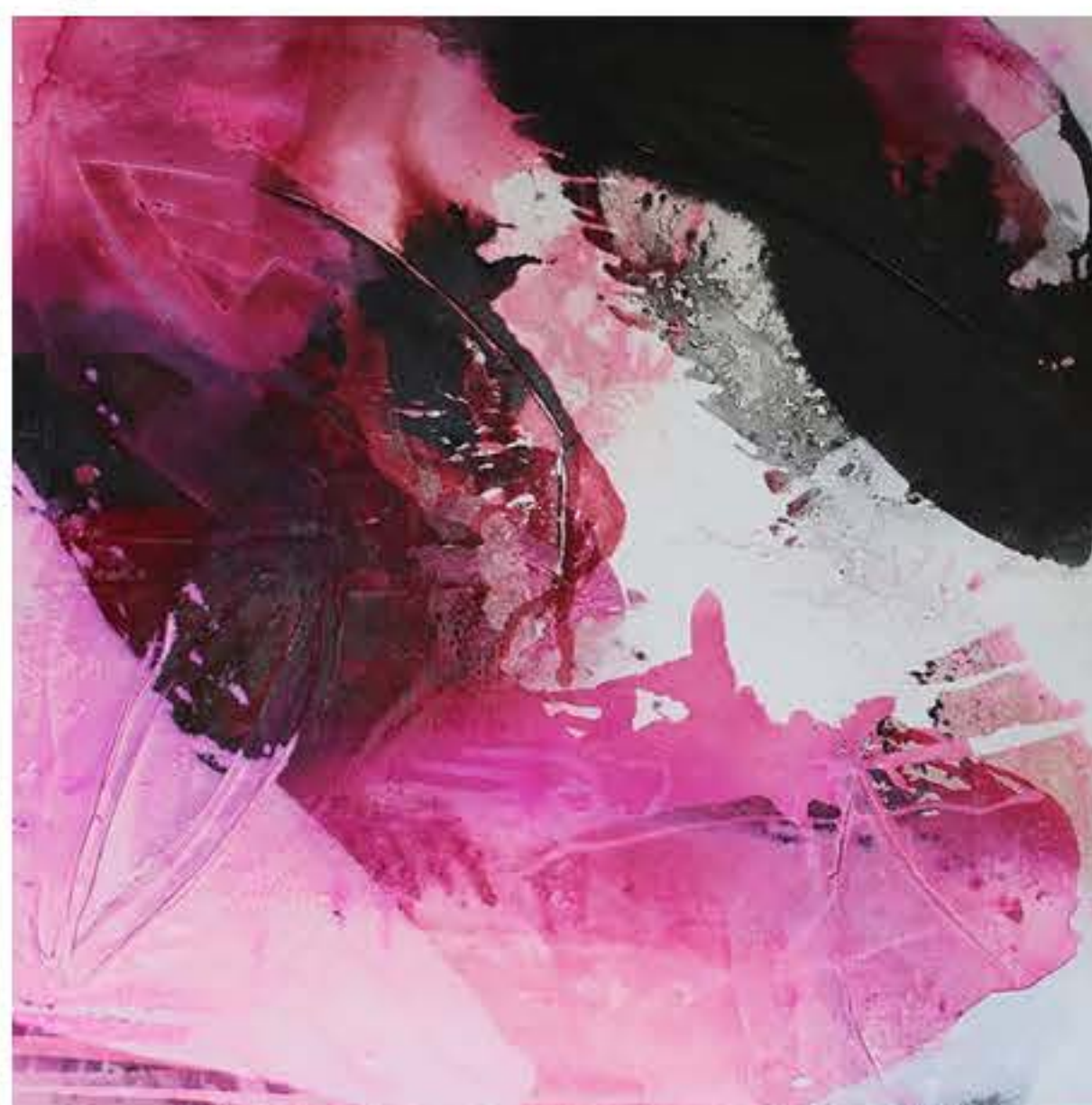
Karin Handel-Daiker „Purple Rain“ 2023, Beize, Öl, Spachtelmasse auf Leinwand, 100 x 100cm GALARTERY fine art, Innsbruck-AT