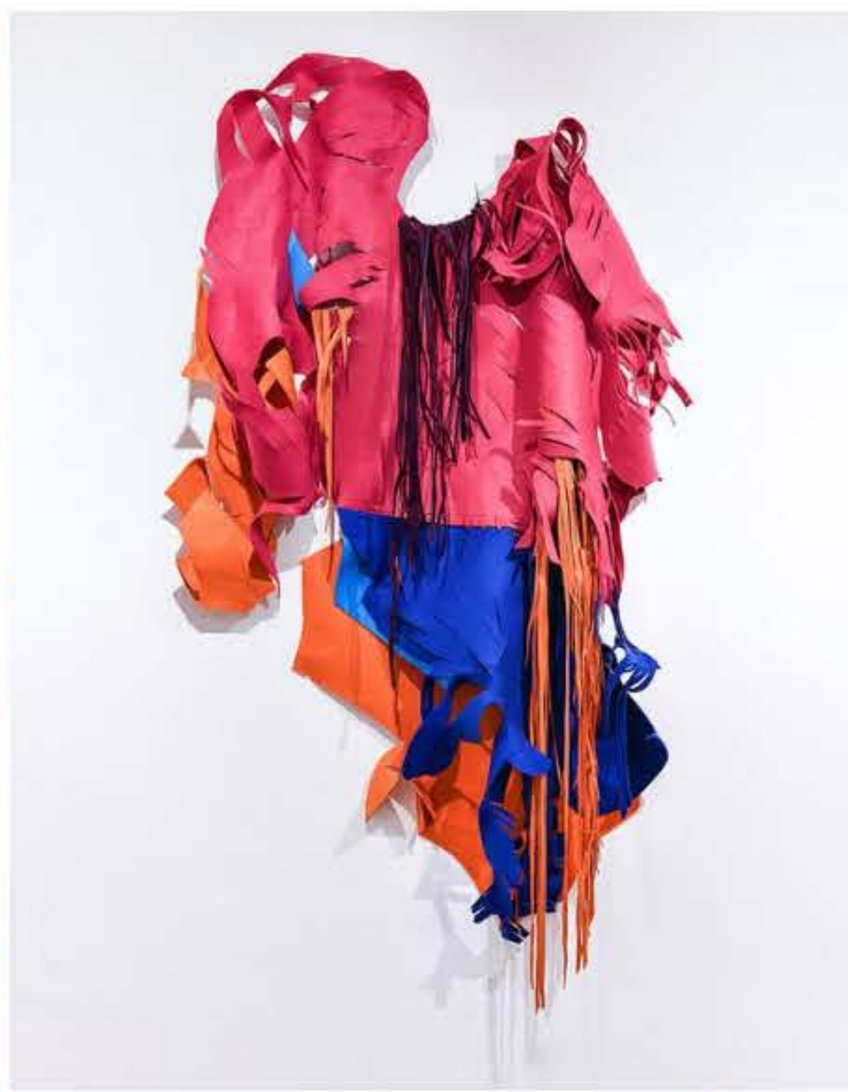
Diána Bóbits „The shape of light, shoulder“ 2022, Filz und Textilien, 170 x 200 cm, Kunstfakultät der Universität Pécs Ungarn